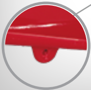
Ojillos para Barboquejo en la parte interna.