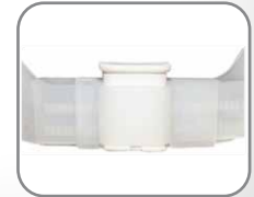
Broche ambidiestro con ajuste FAST FIT®.