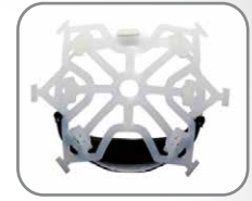
Suspensión de 6 puntos. Con dubetina para dar mayor confort.